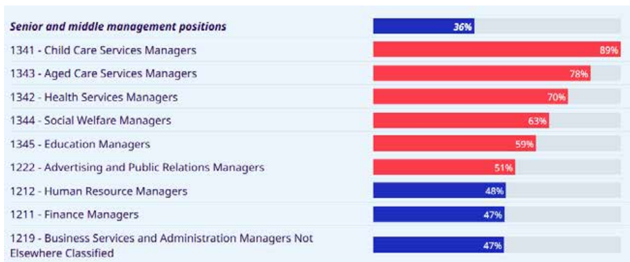
Рис. 3. Вертикальна сегрегація: частка жінок на посадах вищого та середнього керівного складу