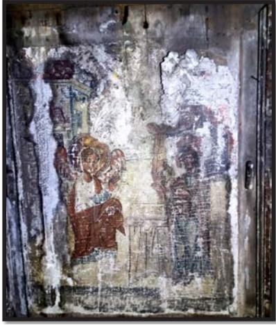
Рис. 17. Ікона «Благовіщення Пресвятої Богородиці», яка виявлена на дзвіниці церкви села Лудин

Висновки. Впродовж 2022–2023 рр. працівниками Нововолинського історичного музею