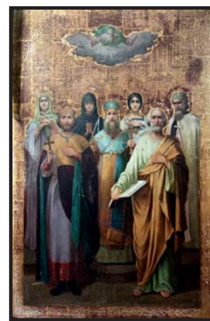
Рис. 8. Сімейна ікона родини Дверницьких. Кінець XIX ст.

На основі архівних відомостей вдається також віднайти ікони, які представляють собою цінний історичний матеріал. Наприклад, за церковним описом 1925 р., який віднайдено у Покровській церкві села Грибовиця знайдено сімейну ікону дворянського роду Дверницьких, які були власниками села Будятичі. Ікона датується кінцем XIX ст. На ній зображено святі патрони найближчої родини Омеляна Дверницького [Див.: рис. 8]. Зокрема, патрон батька Омеляна – Святий Миколай увіковічений на окремій іконі такого ж стилю.