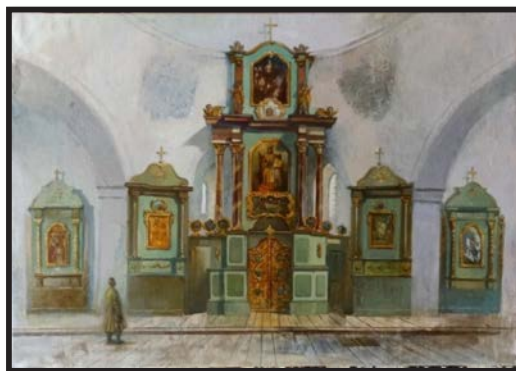
Рис. 4. Ілюстрована репродукція іконостасу Низкиничівського монастиря станом на кінець XVIII ст.

кінець XVIII ст. Її здійснив художник-реставратор А. Погрібний [Див.: рис. 4].