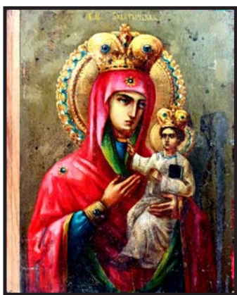
Рис. 14. Чудотворна Будятичівська ікона Божої Матері

Перш за все, на металевому окладі було виявлено напис, у якому зазначалося, що ікона піддавалася реставрації з нагоди її 300-ліття, в 1937 р. з ініціативи священника Ісидора Вакуловича. Після зняття металевого окладу та огляду ікони, стало очевидним, що є сліди реставрації тих часів. Рентгеновське дослідження також продемонструвало збереження незначної кількості окремих живописних частин ікони до реставрації, що підтверджувало її оригінальність [Див.: рис. 15]. Враховуючи, що реставрація 1937 р. могла спричинити значні зміни у зображенні Пресвятої Богородиці, нині проводяться пошуки збережених фотографій ікони кінця XIX – початку XX ст. Згідно переліку речей, що перебували в кінці XIX ст. у Володимир-Волинському древньосховищі, відомо, що український мистецтвознавець, археолог А. Прахов у 1886 р. здійснив фотографування Будятичівської ікони Божої Матері (ВЄВ, 1889, с. 573). Пошуки цієї світлини тривають.