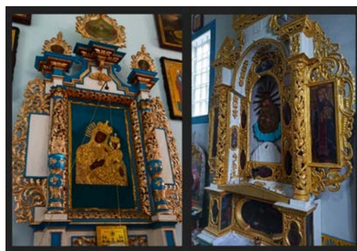
Рис. 5. Вітварі на горному місці. Ліворуч – у храмі села Мишів, праворуч – у церкві селі Хорів

На основі аналізу вітваря Свято-Онуфріївської церкви села Хорів також звернули увагу на його схожість із вітварями Свято-Миколаївської церкви села Мишів [Див.: рис. 5]. Тобто можна з впевненістю заявити, що художні зразки митців Жовківської іконописної школи поширені по усьому півдні Волинської області. Окремі деталі вітваря села Мишів на горному місці зафарбовано емалевою фарбою та потребують відкриття. Згідно опису церкви Мишова за 1925 р. на прихованих зображеннях намальовано образи Святого Аарона та Мойсея зі скрижалями (ДАТО, спр. 652: 106–107). Проте, остаточно можна це з'ясувати після комплексу досліджень.