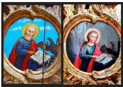
Рис. 3. Один із медальйонів царських воріт церкви села Низкиничі, де зображено Святого Іоанна (праворуч – 1960-х рр., ліворуч – відкрите зображення XVIII ст. після реставрації)

є підтвердженням, що виявлений нижній живописний шар є оригінальним та має датування XVIII ст., коли Низкиничівський монастир належав до Греко-католицької церкви.