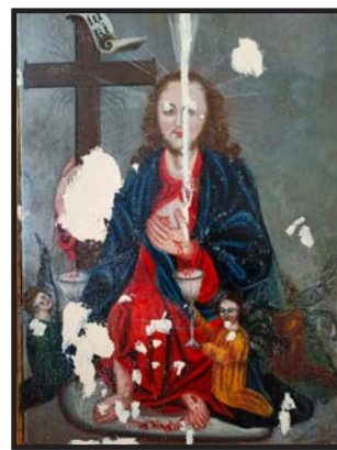
Рис. 10. Первинний сюжет «Христос – Виноградна лоза» на іконі з храму села Гряди, який виявлено під час реставрації. (Білі фрагменти – місця втрат живопису, які реставратор покрив ґрунтом)

рентгенологічного дослідження стало відомо, що під верхнім зображенням також приховано образ, адже яскраво проявлявся лик Ісуса Христа. В процесі реставраційного розкриття стало зрозумілим, що рентген показав третій прихований шар. Первинне зображення датується XVIII ст. і представляє собою малопоширений сюжет – «Христос – Виноградна лоза» [Див.: рис. 10]. Цей образ є глибоко символічним і представляє Ісуса Христа після Воскресіння, акцентуючи на Його жертві та таїнстві Євхаристії. В українському іконописі образ «Христос – Виноградна Лоза» набуває особливої популярності у XVIII ст. Такі взірці трапляються у Галичині, Волині та Центральній Україні, що свідчить про швидке розповсюдження сюжету. Це, зокрема, пояснюється впливом культури бароко із її алегорично-символічними композиціями, які нерідко вимагали складного богословського тлумачення і глибокого знання біблійного сюжету (Косів, 2010). Унікальним є те, що на іконі із грядівської церкви відсутнє зображення виноградної лози. Кров Ісуса Христа із порізів на руці та ребрі стікає у дві чаші, які тримають ангели, таким чином символічно демонструючи, що в чаші для Євхаристії – кров Христа [Див.: рис. 10].