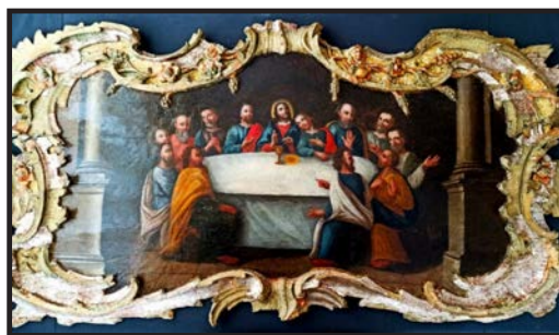
Рис. 2. Ікона «Таємна вечеря» Низкиничівського чоловічого монастиря після реставрації

У лютому 2023 р. в Покровській церкві села Кропивщина вдалося виявити ікону «Таємна вечеря» [Див.: рис. 2], яка раніше знаходилася у Низкиничівській церкві над царськими воротами іконостасу. Потрапила ця ікона до церкви Кропивщини у 1998 р., коли було зведено місцевий храм, який потребував внутрішнього наповнення культовими речами. Тоді настоятель церкви Низкинич передав ікону «Таємна вечеря» до Кропивщини, де вона перебувала в інтер'єрі тривалий час. З появою ушкоджень на іконі, її було розміщено в горизонтальному положенні на шафі у церкві. Після виявлення ікони стало зрозуміло, що є можливість віднайти інші втрачені частини іконостасу. Як результат, впродовж 2023 р. було знайдено ікону «Причастя Святого Онуфрія», а також «Св. Василій Великий». Подальші пошуки інших частин Низкиничівського іконостасу тривають.