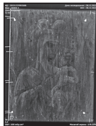
Рис. 15. Рентген-знімок Будятичівської чудотворної ікони Божої Матері

на їхні історичні цінності й значення для охорони культурної спадщини в цілому.