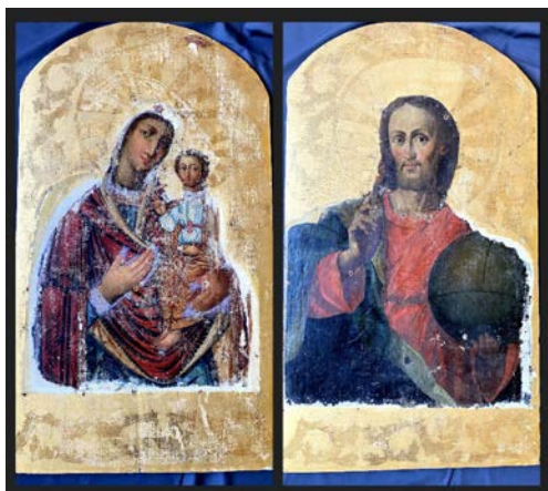
Рис. 9. Відкриті ікони із-під полотен у храмі села Заболотці