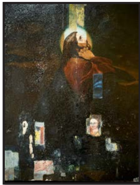
Рис. 12. Ікона «Моління про чашу» із Грядівської церкви (світлі частини – розвідувальні розчищення нижніх шарів)

У Грядівській церкві на реставрацію було також взято ікону «Георгій Переможець». Враховуючи її розміри й форму можна вважати, що в минулому розміщували ікону на дияконських дверях іконостасу одного із місцевих храмів. Ця ікона опинилася у церкві села Гряди на початку 1990-х рр., коли було відновлено