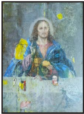
Рис. 11. «Хлібний Спас» із храму села Гряди, відкритий під час реставрації. XIX ст. (Лик ангела та нога – нижній шар ікони «Христос – Виноградна лоза»)

коли подав апостолам хліб і вино. Такий сюжет ікони був поширений в XIX ст. Третій сюжет, який був поверхневим – це ікона «Моління про чашу», яка була намальована в середині XX ст. [Див.: рис. 12]. Таким чином на одній дошці написано в різні часи три сюжети однієї події – таїнства Євхаристії. Художником-реставратором А. Погрібним було знято два нашарування та відкрито ікону XVIII ст. У храм Казанської ікони Божої Матері було повернуто відтворену на новій дошці ікону «Моління про чашу». Реставрація оригінальної дошки ще триває.