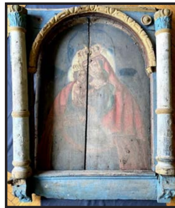
Рис. 7. Дореставраційне зображення Почаївської Пресвятої Богородиці (під ним – прихований образ Спасителя) у кіоті із села Заболотці

Кіот ікони також представляє рідкісну, збережену до нині пам'ятку [Див.: рис. 7]. Внизу вдалося розкрити напис кінця XVII ст.: пречтому ти образу поклоняємься бл҃҃҃їи прослаше прошенїа прегрѣшенїе наш хѣ бѣ («Пречистому твоєму образу поклоняємося. Благі просять прохання [на молитву за] гріхи наші Христе Боже»). Кіот повністю перемальовано олійними фарбами в XIX–XX ст. Зондаж показав наявність сусального срібла на декоративних елементах кіоту. Передбачається тривала і кропітка реставраційна робота із відновлення його оригінального вигляду.