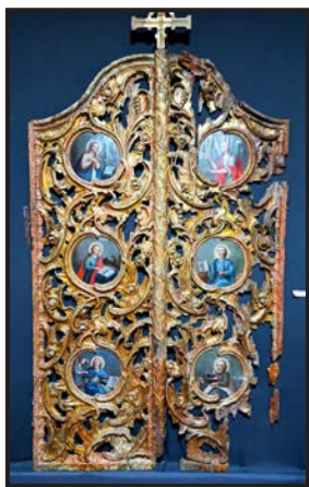
Рис. 1. Царські ворота Низкиничівського чоловічого монастиря після реставрації

метою і завданням дослідження є демонстрація й узагальнення отриманого досвіду з вивчення іконопису Волинського Прибужжя, активізація таких же процесів в інших регіонах України, задля порятунку та охорони сакральної спадщини українського народу.