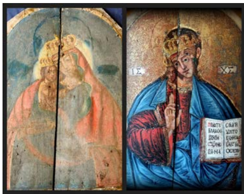
Рис. 6. Ікона із Хресто-Воздвиженського храму села Заболотці. Зліва – образ Почаївської ікони Божої Матері, справа – відкритий образ Спасителя під час реставрації (на ньому ще зображене обличчя і корона з Почаївської Богородиці)