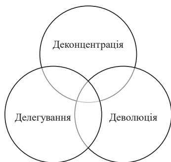
Рис. 1. Характеристики змісту поняття «децентралізація»

Загальний зміст децентралізації описується за трьома характеристиками (рис. 1).