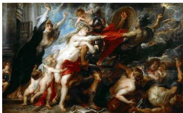
Рис. 6. Наслідки війни, Рубенс. Фото: Web Gallery of Art (Wikipedia)

Звернімось до прикладів, коли універсальність підходу підсилюється місцевим культурним спадком. Цікавим з точки зору роботи з виразним регіональним контекстом має Лувр у Лансі. Колекція Лувру здебільшого сформувалась у середині XIX століття, у той самий