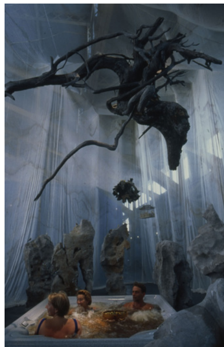
Рис. 5. Ванна плавильні культур, Цай Гоцянь.

на Біенале сучасного мистецтва в Ліоні у 2000 році. Інсталяція складається із чотирьох елементів – прозорі тканини, каміння, птиць (усе походженням з різних провінцій Китаю), і джакузі з лікувальними травами, вочевидь у європейському стилі. Цай заохочував відвідувачів зануритися в ці води плавильні культур, щоб зцілитися.