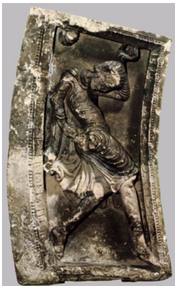
Рис. 4. Жонглер, 1200 р., камінь, Музей мистецтв Ліону.

і вважалася культурною спадщиною німецького народу. Вона має форму храму й увінчана делікатним розп'яттям. У середині дароносиці розташована прозора кристална ємкість, у якій зберігається зуб, який, за переказами, належав Іоанну Хрестителю. Так от ця ємкість була зроблена у Фатімідському халіфаті, а коли в XI столітті палац каліфа аль-Мустансіра було пограбовано, вона опинилася в Константинополі, а після падіння Візантійської імперії – у Європі, як надбання четвертого хрестового походу (1204 р.). Цей артефакт оповідає нам історію Середземномор'я – історію торгівлі, обміну, гібридності форми та іконографії, конфлікуючих вірувань і політичних чинників. Усе це засвідчує факт, що в естетичному об'єкті музейної колекції імпринтовані історичні передумови його створення.