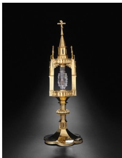
Рис. 3. Срібна дароносиця, яка належала до німецької церковної скарбниці.

плутанини, що призводить до політичної, а потім і до воєнної артикуляції сучасного націоналізму. У своїй полеміці проти хибного використання історії Патрік Гірі пише: «Ми, історики, створюючи ілюзію тяглості і лінійності історії народів Європи, «легітимізуємо» спроби військових командирів та політичних лідерів привласнити прадавнє минуле та модифікувати його до власних потреб» (Geary P., 2002, с. 109). Ці слова набувають особливої актуальності у світлі повномасштабного вторгнення Росії в Україну, підйому популістського етнонаціоналізму у Європі. Патрік Гірі у своїй книзі «Міф про нації: середньовічні витoki Європи» зазначає, що сучасна історія народилася у XIX столітті. Замислена та розвинута як ідеологічний інструмент європейського націоналізму історія європейських націй була надзвичайно впливова у прагненні насадити національні наративи та міфи, однак сучасна історія перетворила наше розуміння минулого у «купу токсичного сміття, отруєного етнічним націоналізмом» (Geary P., 2002, с. 123). І завдання сучасних істориків, проводить же він, полягає в розчищенні цього сміття.