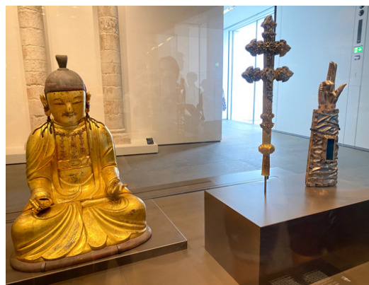
Рис. 2. Лувр Абу-Дабі.

І продовжується наскрізно в експозиції, де, наприклад, поруч можна побачити золоте християнське триперстя та Будду в позі лотоса, який склав пальці в мудру аналогічно триперстю.