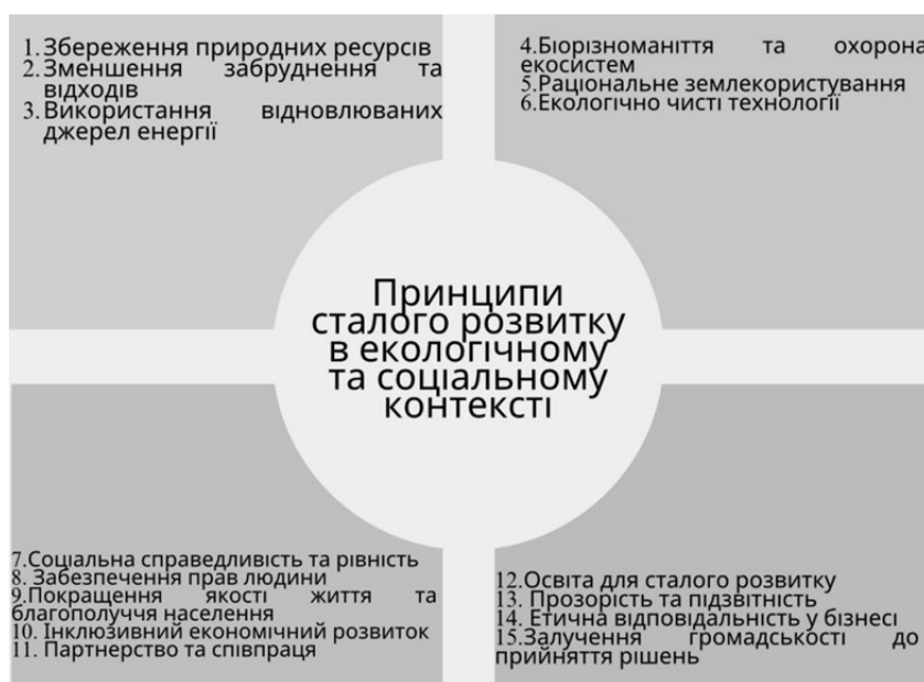
Рис. 2. Принципи сталого розвитку в екологічному та соціальному контекстах

Філософські підходи до інновацій та сталого розвитку в екологічному та соціальному контекстах відображають глибокі переконання та цінності, які формують нашу взаємодію з довкіллям і суспільством (Sakalasooriya, 2021). Вони допомагають визначити, як слід розробляти та впроваджувати нововведення,