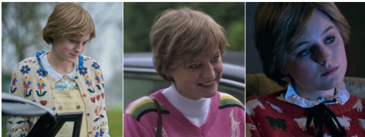
Рис. 2. Дитячі візерунки в одязі принцеси Діани в четвертому сезоні «Корони»

Другий епізод продовжує асоціацію з природою, він складається з паралельного