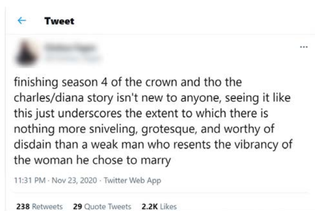
Рис. 1. Твіт з реакцією після четвертого сезону серіалу «Корона»

майже 20% з 814 респондентів погіршили своє відношення до принца Чарльза після виходу серіалу (Cobo, 2021). Серіал також був розкритикований за свою історичну точність та здатність вводити в оману аудиторію (English, 2020; Vickers, 2020; Jenkins, 2020). Отже, четвертий сезон серіалу «Корона» актуалізував питання співвідношення правди та вигадки у історичних серіалах та їх вплив на аудиторію.