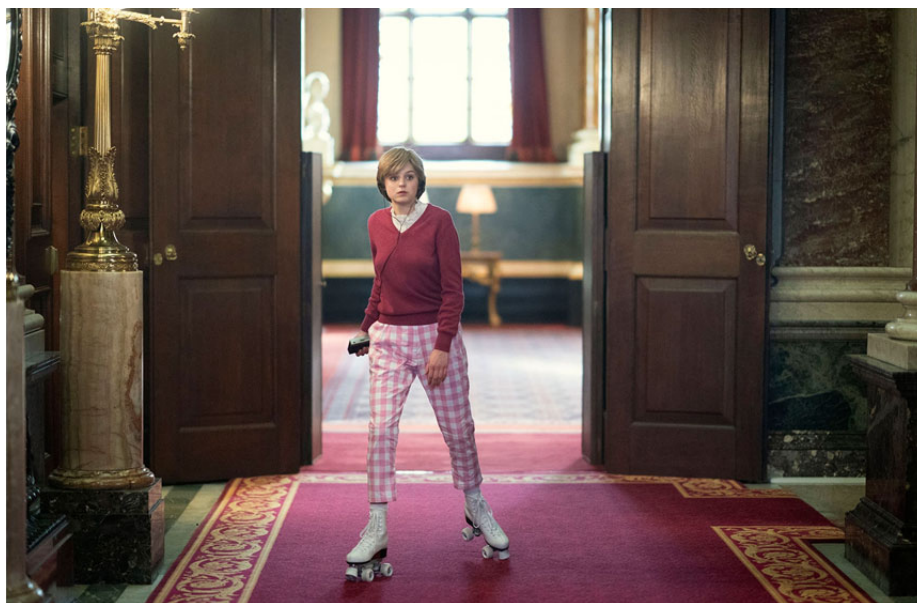
Рис. 3. Сцена з третього епізоду, у якій принцеса Діана катається на роликах у палаці

монтажу між полюванням на оленя та тестом королівської родини, який проходить Діана Спенсер. Глядачі знають, чим закінчується історія для оленя та асоціюють це із ситуацією з Діаною Спенсер. Наприкінці епізоду журналісти зустрічають Діану Спенсер на вулиці та переслідують її, щоб зробити фото та отримати коментарі про її стосунки з принцом Чарльзом. У цьому епізоді також важливу роль відіграє музика. Це композиція Джузеппе Верді «La Traviata Prelude» з опери «Травіата» (від ital. la traviata – «впав», «заблукав», від