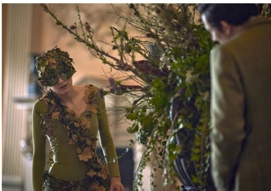
Рис. 4. Принцеса Діана у костюмі «скажене дерево»

Іншим символічним аспектом образу принцеси Діани у серіалі є колір. Досить часто принцесу Діану можна побачити у синьому одязі (рис. 5). У третьому епізоді у сцені з вибором обручки вона спочатку вибирає кільце з червоним каменем, але дізнається, що воно пов'язане з королівською сім'єю та вибирає іншу каблучку із синім каменем.