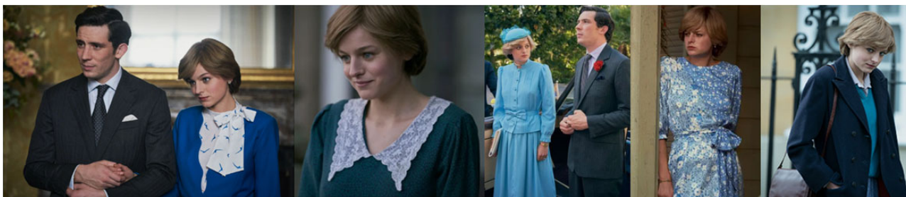
Рис. 5. Принцеса Діана в одязі синього кольору

Синій колір мав особливе значення для романтичного руху, він був кольором кохання, меланхолії та мрій (Pastoureaux, 2001, р. 139). Блакитна квітка (нім. blaue blume) була центральним символом натхнення для німецького романтизму. Її ввів німецький письменник Новалис у своїй незакінченій історії дорослішання під назвою «Генріх фон Офтердінген» (Pastoureaux, 2001, р. 139). В англо-американській традиції слово «blue» (у перекладі синій), яке багато мов прийняли без змін, використовується як термін для меланхолії, ностальгії та депресивних настроїв (Pastoureaux, 2001, р. 140). Так само образ принцеси Діани є провідником романтичних настроїв у серіалі.