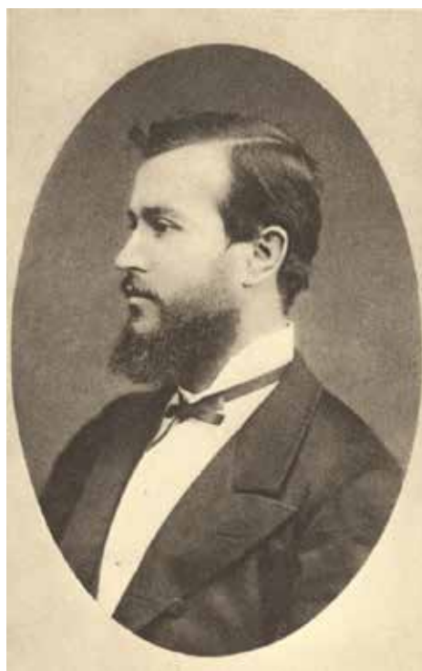
Рис. 1. Т. Г. Масарик. 1877 р. (Кобильченко В.)

Саме Чехословацька республіка серед держав, що тільки починали свій шлях активних учасників міжнародних відносин стала тією