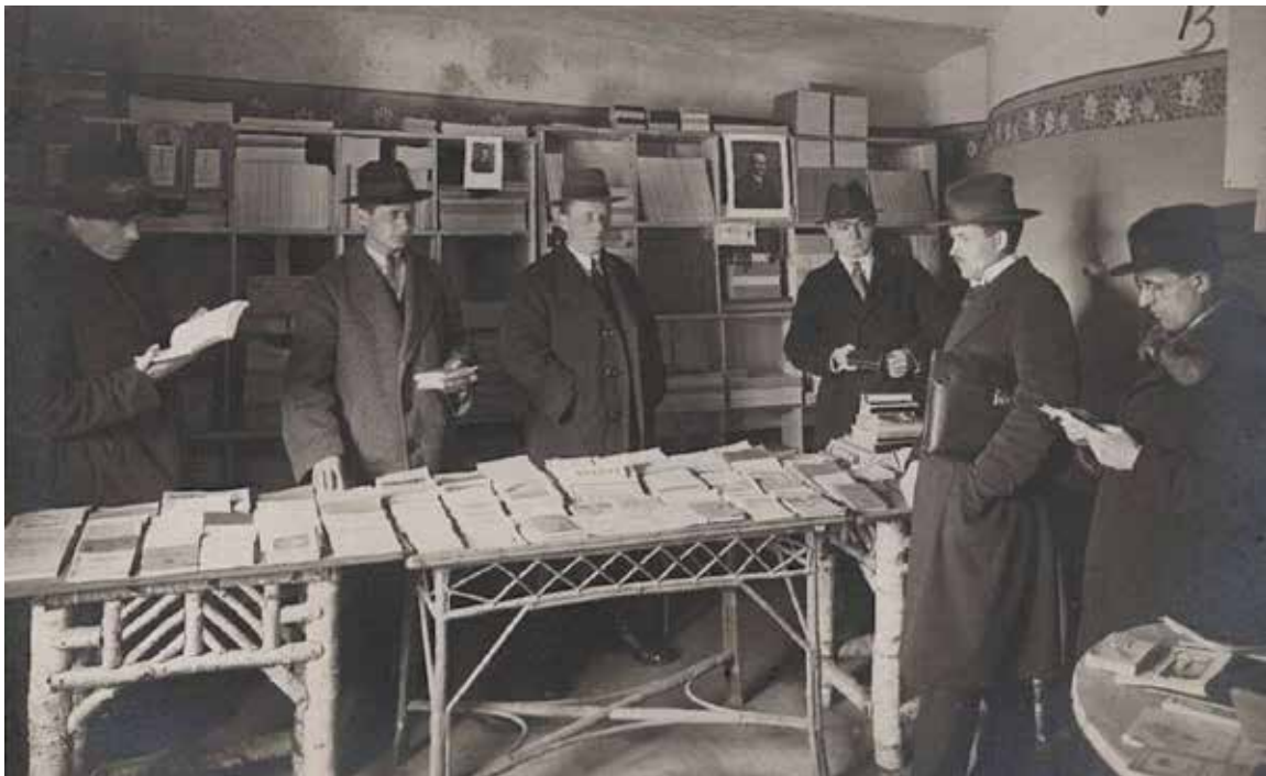
Рис. 4. Книжкова крамниця при УГА, 1924 рік. (Наріжний С., т. 1, с. 120)

Факторами, що спричинили закриття Академії вважають економічну кризу та зменшення фінансування (Наріжний С., т. 1, с. 164). Водночас були інші версії причин закриття Академії. В емігрантських колах згадувався вплив країн, вороже налаштованих до справи державного відродження українського народу (насамперед Росії) та неприхильне ставлення до Академії міністра сільського господарства Срдітки (Моренець В.).